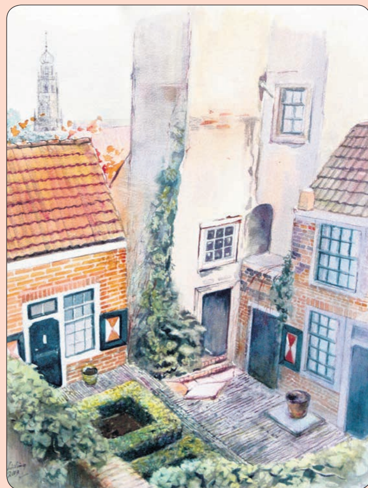
> illustratie: Otto Schilling