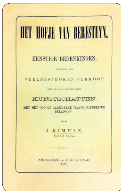
> De voorkant van het pamflet tegen de verkoop van de ontbrek aan Frans Hals toegeschreven schilderijen, 1876.