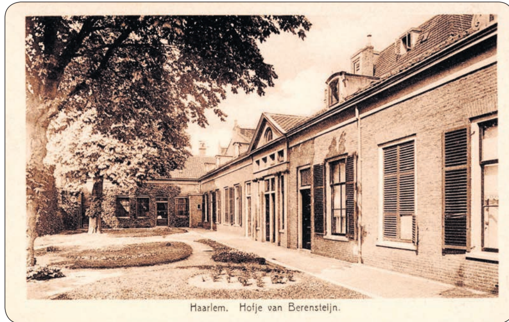
Haarlem. Hofje van Beresteyn.

Naast dit in 1688 gebouwde Hofje van Beresteyn verrees in 1885 het tweede Hofje Van Codde. Het eerste uit 1609, op het Klokhuisplein, werd rond 1880 gesloopt