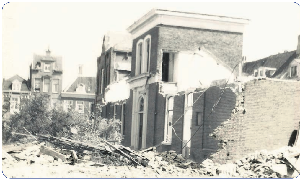
> Sloop van het hofje Codde uit 1969 gemaakt door H.A. Hoogvelt