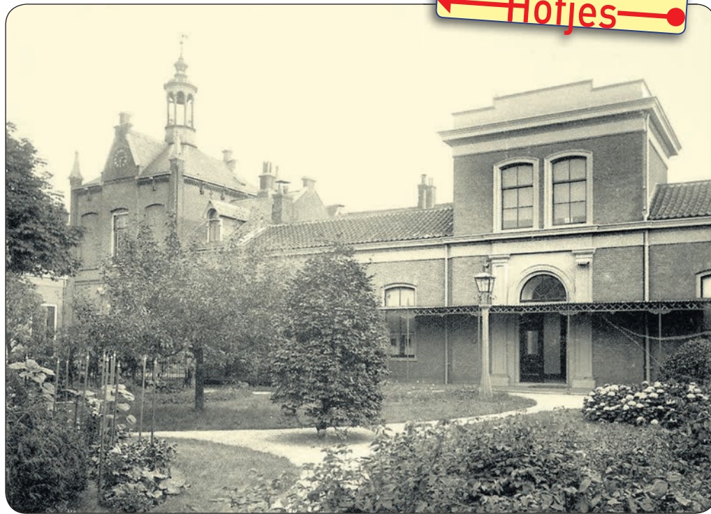
> Het hofje van Beresteyn (links) en het hofje van Codde, twee liefdadigheidshofjes in de Lange Herenstraat, die in 1969 werden gesloopt. Foto: Berend Zweers, 1904.

In Haarlem zijn in de loop der eeuwen zo'n dertig hofjes verdwenen, meer dan de helft arbeidershofjes. Het is niet voor niets dat juist de liefdadigheidshofjes de tand des tijds hebben doorstaan. Meer geld bij de bouw voor materiaal en ambachtlieden van kwaliteit betekent een beter fundament voor later.